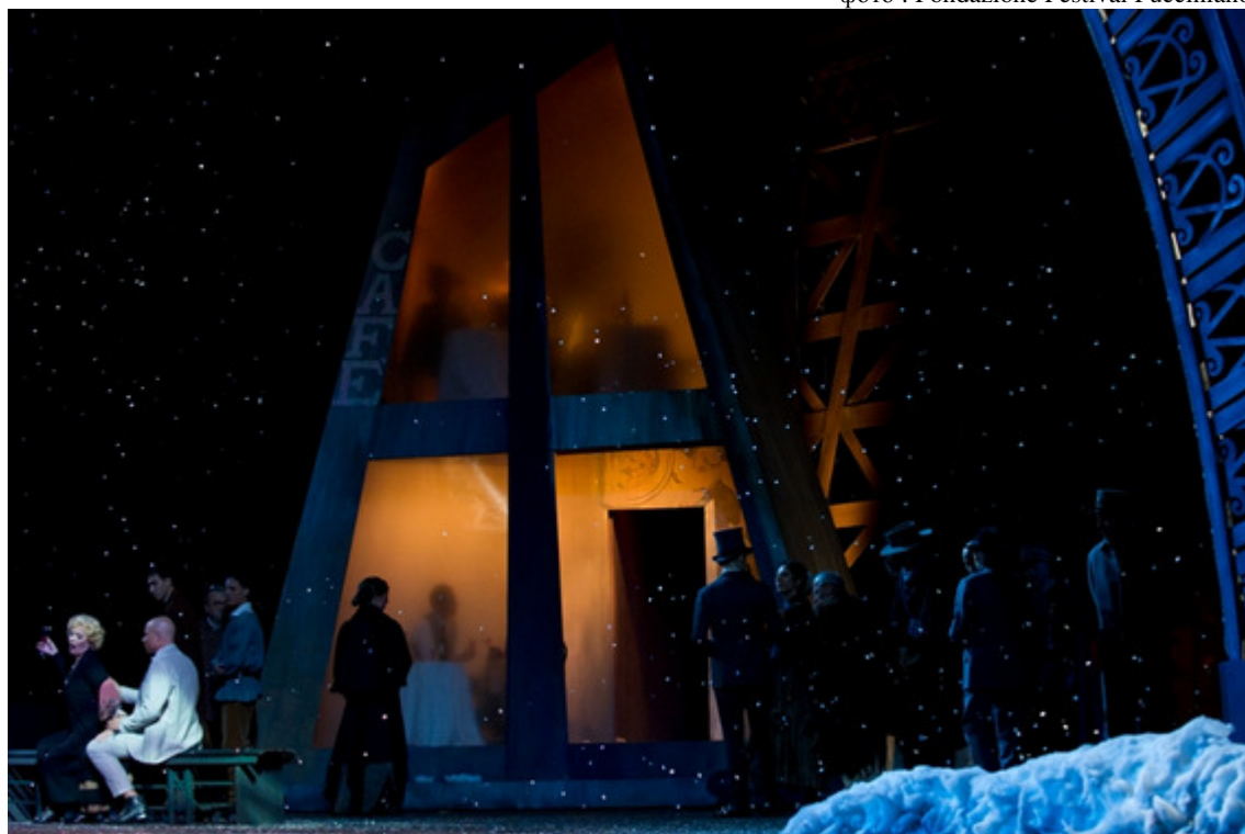
Сцена из третьего акта «Богемы»