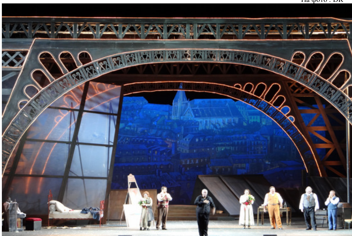
Даниэль Орен на поклонах после представления «Богемы»

Благодаря необычайно искусному, высококачественному дирижированию Орена, исполнители оперы получили все возможности для максимального проявления своего вокального дарования. Несмотря на довольно трудные для пения замедленные темпы, почти все артисты успешно спели свои партии.