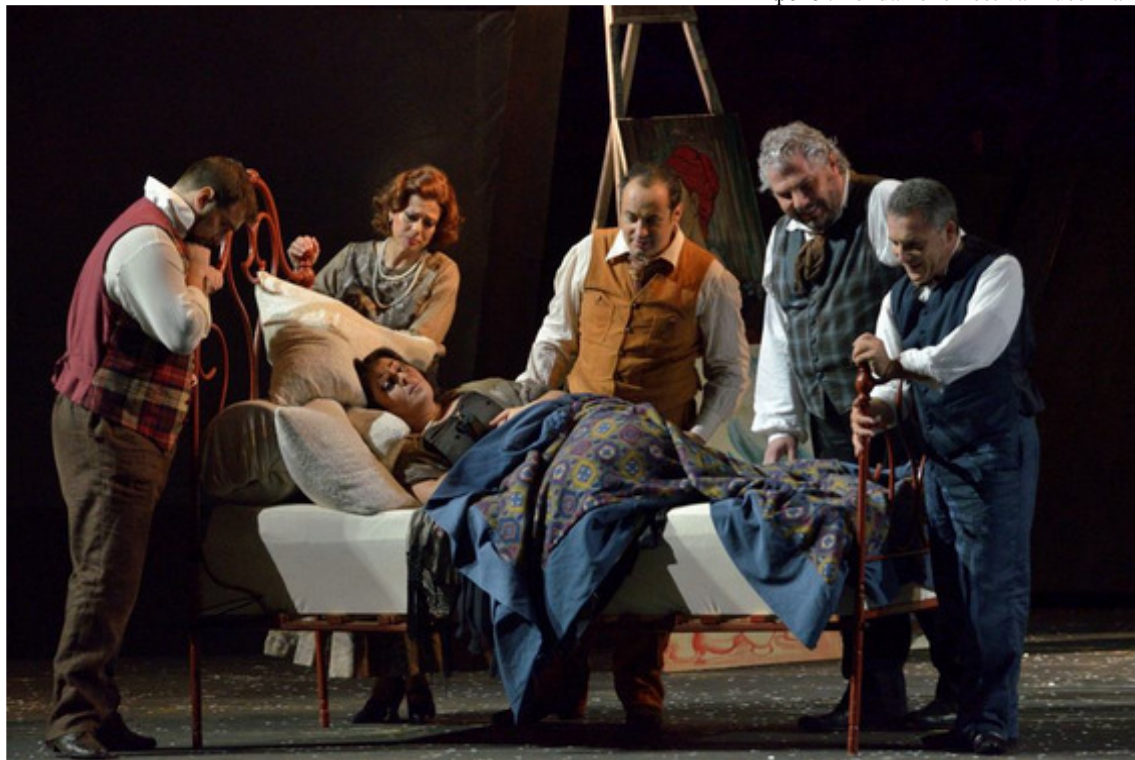
Смерть Мими - финальная сцена «Богемы»

Режиссер выстроил спектакль вполне традиционно, без особой фантазии. Наибольшее впечатление производит второй акт. Его действие происходит в Латинском квартале накануне Рождества. В предпраздничной суе участвуют все солисты, многочисленные статисты и два хора, включая детский, который пленяет, конечно же, не только задорным пением, но и театральным озорством. Несмотря на впечатляющие брожения огромной толпы и сценографические метаморфозы, в этом акте все-таки присутствует досадная статика.