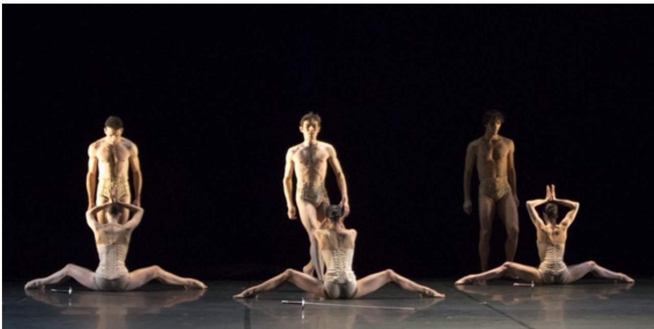
Сцена из балета «Маленькая смерть» в исполнении солистов Оперы Бордо

Вечер открыл Шарль Жюд: в кратком вступительном слове он описал масштаб личности Нуреева, значимость и влияние его творчества на новую генерацию артистов. В двухактном представлении, длившемся два с половиной часа, выступили артисты разных поколений и танцевальных школ. Честь открытия гала получили солисты Балета Оперы Бордо: в их исполнении символично прозвучала, даже с некоторой долей поэтической ностальгии, «Маленькая смерть» - изысканный и чарующий шедевр Иржи Килиана, созданный на музыку Моцарта.