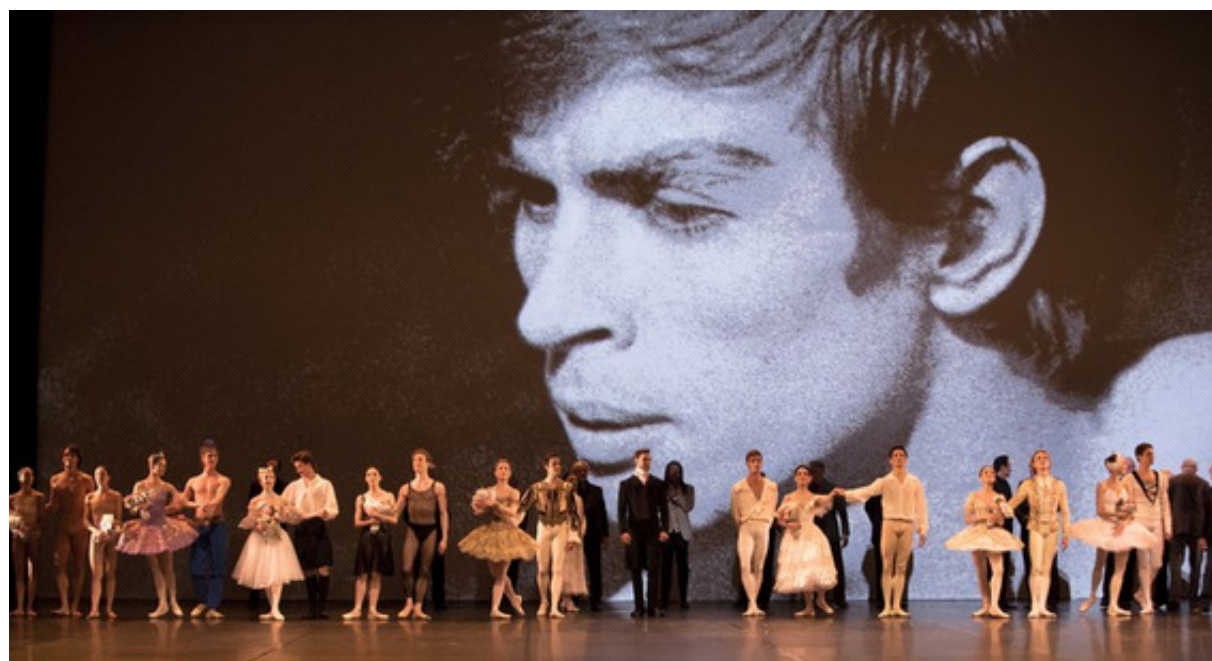
Финальные поклоны артистов - участников гала

Информация на сайте: http://www.noureev.org/rudolf-noureev-actualites/noureev-and-friends-palais-des-congres