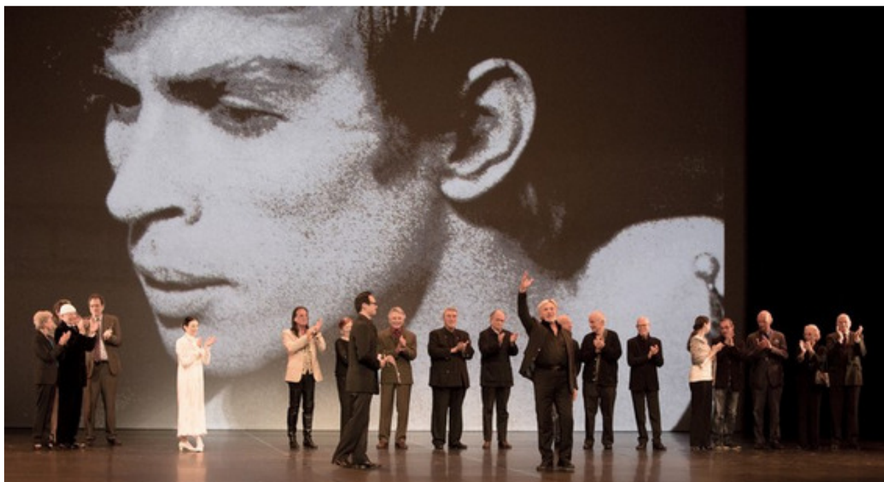
Владимир Васильев приветствует парижскую публику

Мемориальный вечер в Париже был снят несколькими телекамерами для последующего издания DVD. Так, что вскоре все балетоманы мира смогут увидеть этот прекрасный гала-концерт.